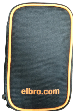
Etui CA17 E-No 980 910 049