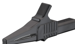
Pince crocodile XKK1001/1