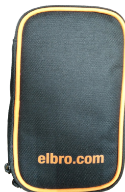
Etui CA17 E-No 980 910 049